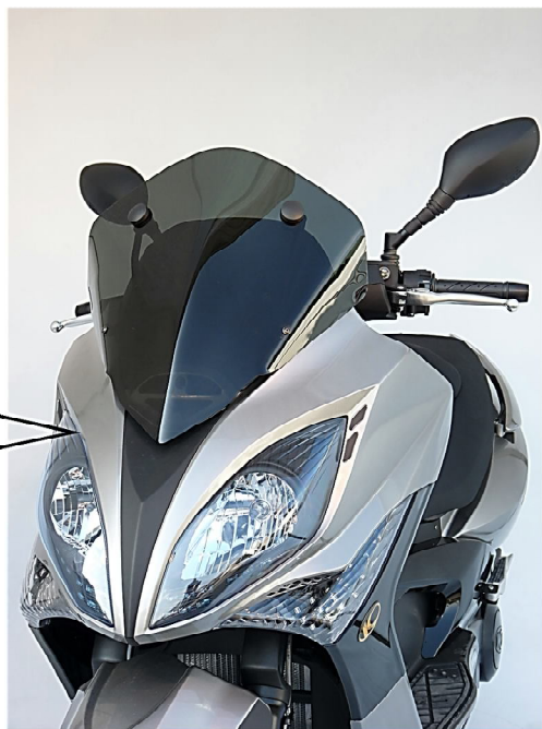
2683/LD SUMMER LUCEDENTRO